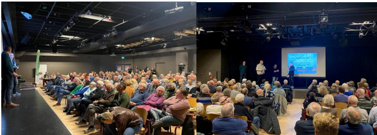
Thema avond 'verkeer'

De wijkraad heeft hierbij ook bewoners gevraagd om (NAW)-gegevens achter te laten, indien zij mee willen denken over toekomstige thema's die in de wijkraad besproken worden. Er zijn diverse gegevens verzameld van bewoners die hier gebruik van willen maken. Deze lijst zal worden gebruikt bij toekomstige participatiemomenten. In 2024 staan de 3 overige thema-avonden op de planning, Het gaat om de thema's 'jongeren', 'welzijn' en buitenruimte'.